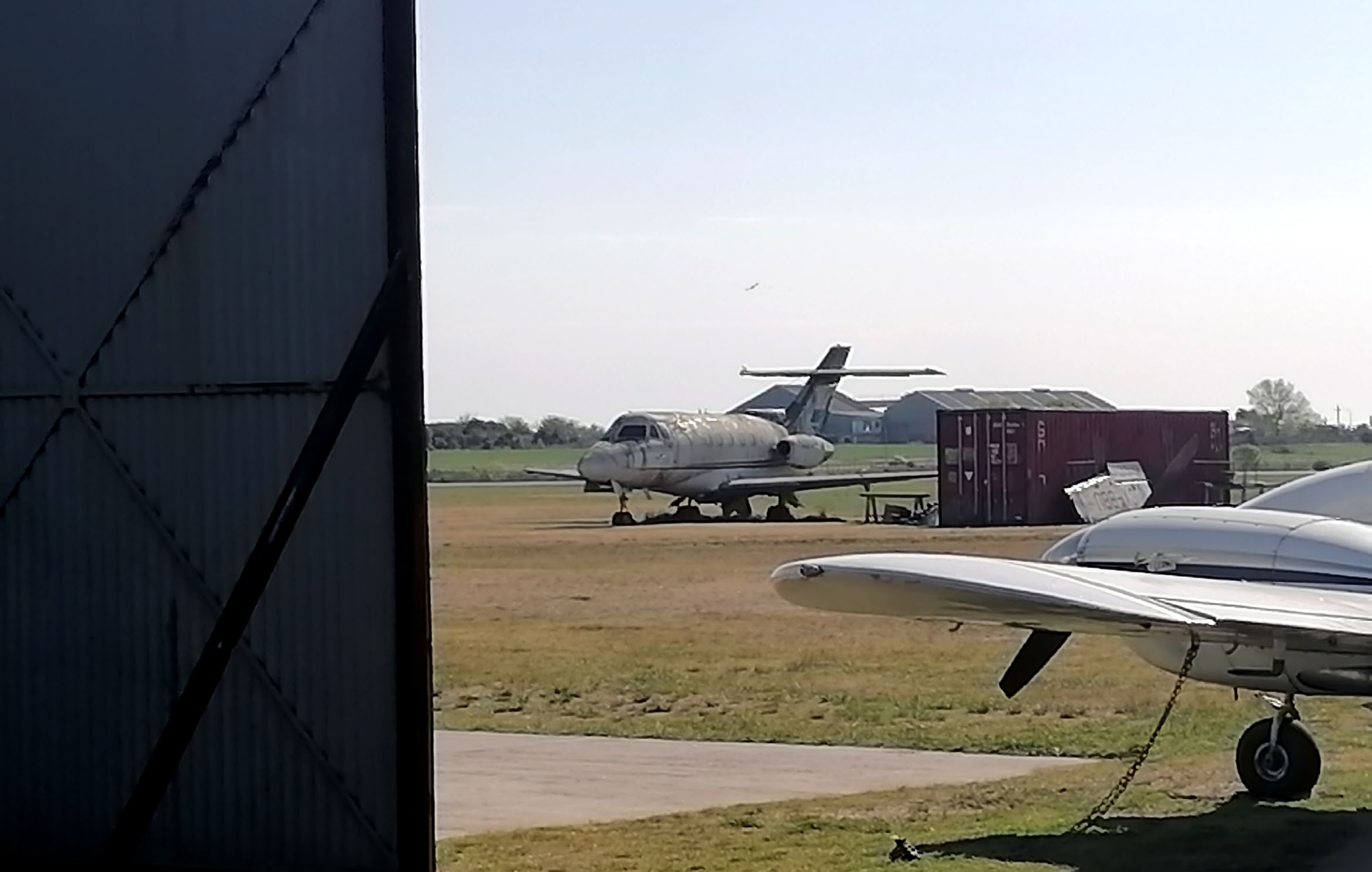
Vista de la aeronave desde Camino Melilla