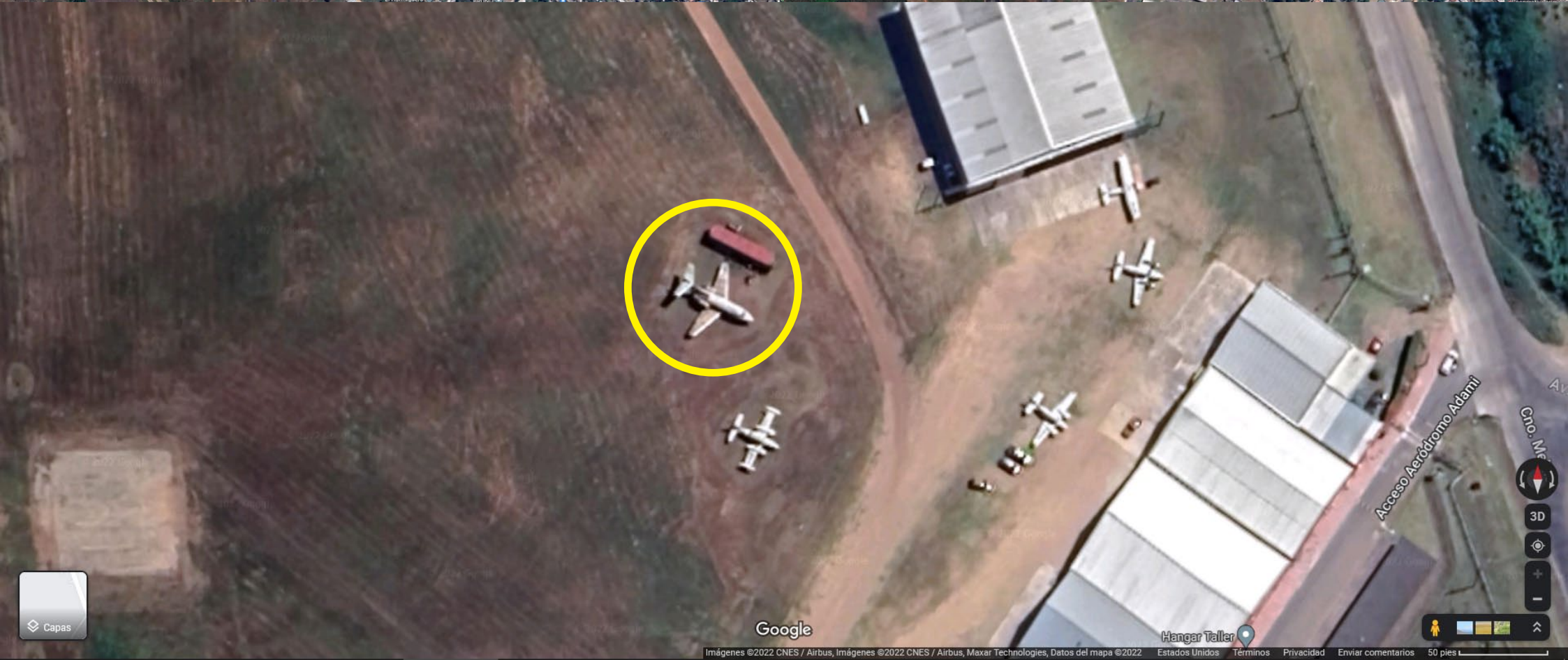
Ubicación del avión en el aeropuerto de Melilla