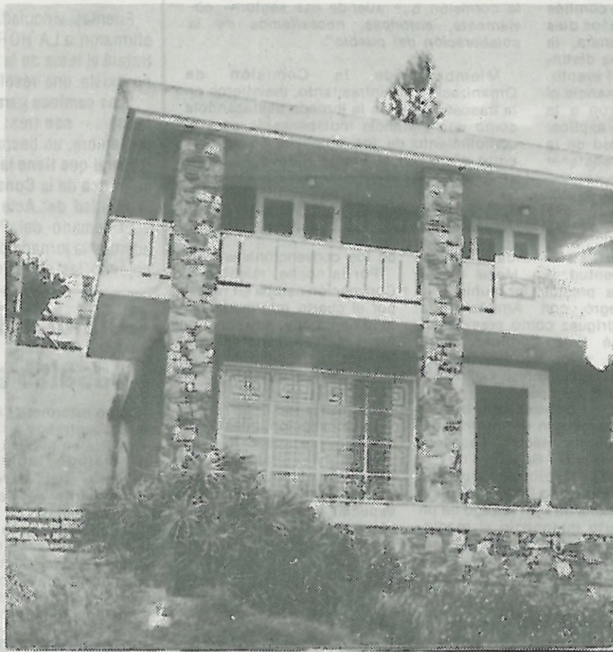
La "Casa de Punta Gorda", centro de torturas al que fueron trasladados varios uruguayos detenidos en Argentina que habían estado en "Automotora Orletti".