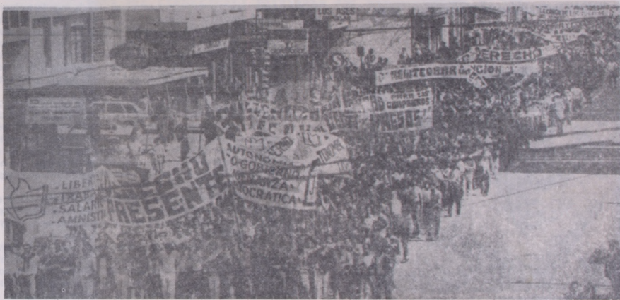
Vista parcial de la manifestación que se realizó el 25 de setiembre

La gran manifestación popular que tuvo lugar el 10 de mayo en Montevideo, marca un importantísimo jalón en la movilización del pueblo uruguayo que cada día con más firmeza y convicción, desconociendo la represión, le exige a las autoridades militares la libertad de sus presos y el retorno de todos los exiliados.