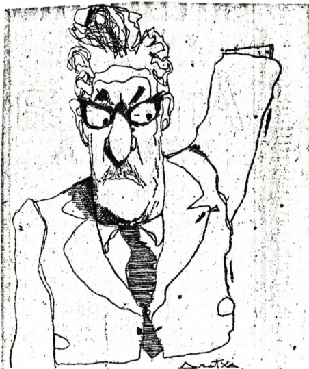
vicepresidente del Consejo de Estado, Dr. Julio César Espfnola.

El Consejero de Estado, Espfnola, realizó declaraciones sobre la Constitución y la Ley Sindical: "En una Constitución más flexible y sintética se deberían incorporar, entre otros, el principio mayoritario. El bicameralismo es el sistema parlamentario uruguayo tradicional. El Acto Institucional No 4, pudo haberse evitado. El pueblo dirá luego de 1985 si lo viejos políticos volverán. Los partidos políticos deben funcionar con bastante antelación al acto electoral de 1981, regulados por su Estatuto. El sindicalismo es indispensable, entre otras razones por la fijación del salario. En Uruguay no se violan los derechos humanos, con terrorismo no se puede transigir,