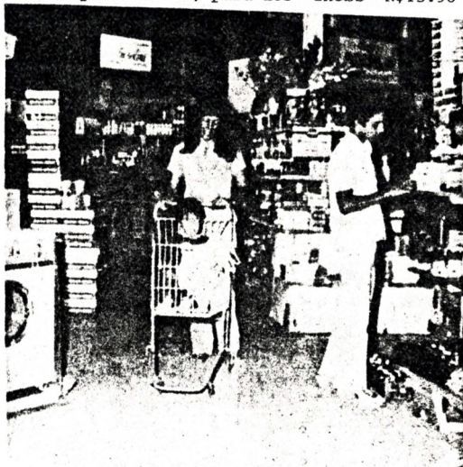
El fascinante paseo de los niños mientras sus padres realizan sus compras en el Supermercado Sol, frente a la Brava.

Queremos en este número, ilustrar con algunos ejemplos prácticos esa tendencia general de la economía. El Uruguay de hoy en día, importa, por ejemplo, cerveza inglesa. La "Allsopp's Lager" cuesta en los supermercados, para los "snobs" N$15.90